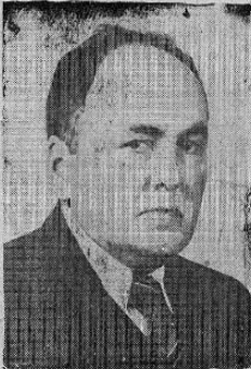
D. Joaquín García Monge

Su nombre ha ido paralelo al nombre de Costa Rica, y al nombrarsele en cualquier país de América se ha hecho para honra de nuestra patria. — Por tal razón el Homenaje que habrá de tributarse el viernes ha de ser homenaje al cual debemos sumarnos todos los costarricenses